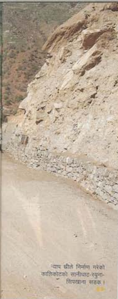
“प्याप धीले निर्माण गरेको कालिकोटको सानीघाट-सुना-सिपखाना सडक।”