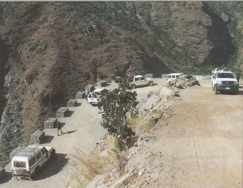
सडकहरू: सञ्जीव शर्मा