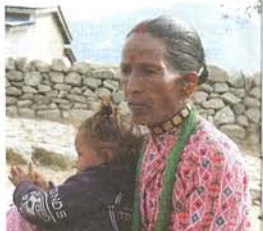
सडकले गर्दा महिलाको हातमा पैसा आएपछि घरेलु हिंसा पनि कम भएको छ।

सडक निर्माणमा कम्तीमा ३३ प्रतिशत महिला अतिव्यय सहभागी गराइएको र समान ज्याला दिइएकाले महिलाहरूको हातमा पनि